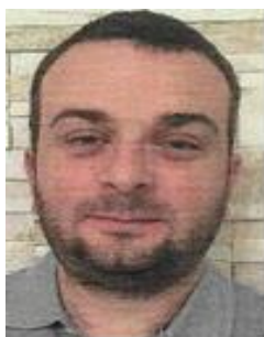
Thomas Ridel Gestion des résultats Inventaire matériel